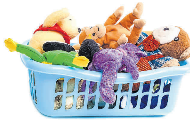
Gut erhaltenes Spielzeug für die Kleinen

In Pfungstadt wird es dafür zukünftig ein zentrales Unterstützungsangebot geben. Ab 15. September trifft sich dort erstmals unter dem Motto „Anders – nicht weniger“ die erste Autismus-Selbsthilfegruppe. Eingeladen sind an jenem Tag alle betroffenen Eltern und Großeltern in die Räume des Kinder- und Familienzentrums Bim Bam Bino, Ringstraße 63, in Pfungstadt. Dauern soll das erste Treffen für rund eineinhalb bis zwei Stunden. Das erste Treffen bietet genügend Raum für ein erstes Kennenlernen und intensiven Austausch. Die Teilnehmenden profitieren von einer adäquaten Wissensvermittlung aber auch dem Erfahrungsaustausch der Betroffenen untereinander. Zwecks Planung wird um eine Voranmeldung bis spätestens 1. September per E-Mail unter anders.nichtweniger@yahoo.com gebeten. Informationen etwa zur genauen Uhrzeit sind dort ebenfalls erfragbar. ● red