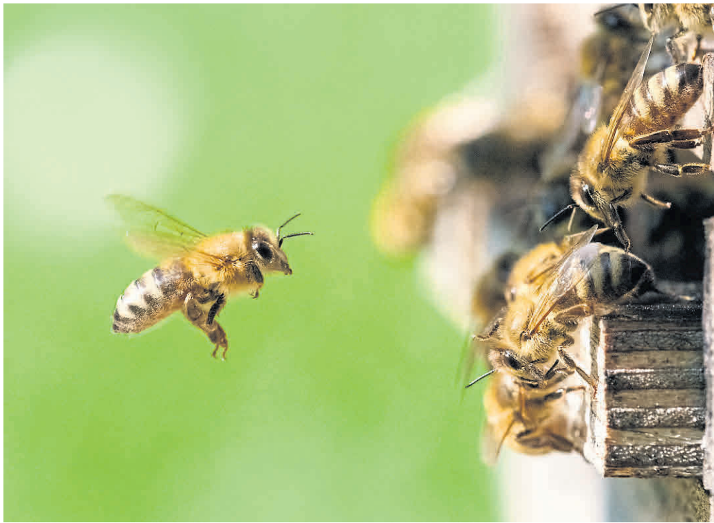
Kleine Wesen ganz große im Fokus: Der neu ausgeschriebene Fotowettbewerb thematisiert Bienen, Schmetterlinge andere nützliche Helferlein.

„Ei was fliegt denn da?“ Dies Frage dürften sich dieser Tage manche stellen, die mit Kamera in der Natur unterwegs sind. Und genau deren fotografische Impressionen sind gefragt in Zusammenhang mit einem Fotowettbewerb. In zweiter Auflage veranstaltet die Stadt Pfungstadt eben diesen gemeinsam mit ihrer französischen Partnerstadt Gradignan, dem Partnerschaftsverein Pfungstadt sowie dem Comité de Jumelage Gradignan. Das Oberthema des Fotowettbewerbs lautet diesmal „Die Bestäuber“. Die fotografisch festgehaltenen natürlichen Augenblicke sollten sich also um jene nützlichen und faszinierenden Insekten wie Bienen, Hummeln und Schmetterlinge drehen, die neben anderen Eigenschaften auch einen Beitrag zu floralen Vielfalt und deren Vermehrung leisten. Gerade jetzt in den Sommermonaten finden sich dazu sicher sehr viele schöne Motive. Ein Grund mehr, die Zeit in der Natur oder zumindest im Freien zu genießen. Denn zum Teil offenbaren sich die geeigneten Augenblicke ja schon vor der eigenen Haustür. Und man muss kein Profifotograf sein, um diese